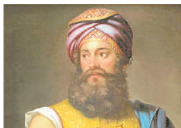
Giovanni Battista Belzoni

Nell'autunno del 1822, Jean François Champollion rompe gli indugi. «Sarei davvero felice se voi volete unirvi a me per un viaggio in Egitto», propone il francese al nuovo amico Giovanni Battista Belzoni. Il padovano si illumina, vede il Decifratore e lo Scopritore allearsi nel nome della conoscenza e della divulgazione della storia egizia. /PAGINA 32