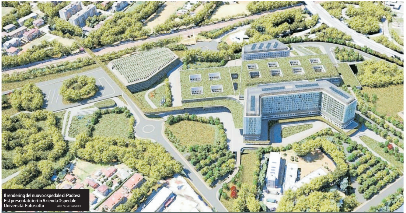
Il rendering del nuovo ospedale di Padova Est presentato ieri in Azienda Ospedale Università.